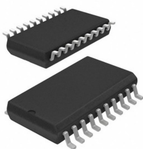
Image nümayəndəlik ola bilər. Məhsul detalları üçün spesifikasiyalara baxın.