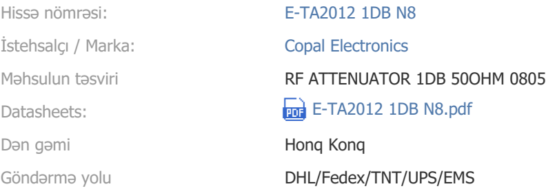
Image nümayəndəlik ola bilər. Məhsul detalları üçün spesifikasiyalara baxın.